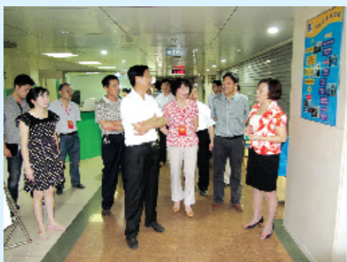
“亮睛工程”得到各界好评

鲁山县人民医院现有职工950人,其中在职工764人,卫生专业技术人员639人,高级职称41人,中级职称132人,初级职称466人;开放床位910张,开设临床医技科室36个;年门诊量60万余人次,年住院患者5万余人次;拥有1.5T核磁共振、直线加速器、16排CT、DR、CR、飞利浦四维彩超、培养全自动生化免疫一体机、五分全血分析仪、全自动血凝分析仪、C形臂数字减影机等大型医疗设备90余台;曾荣获全国百佳优质服务示范医院、“十一五”期间河南省卫生系统行风建设先进集体、河南省卫生先进单位、河南省园林单位、平顶山市文明单位、平顶山市卫生工作先进集体等称号。