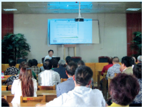
举办健康知识讲座